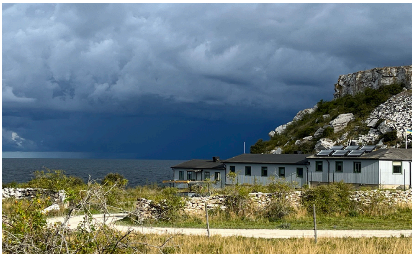
Festlokal på första parkett