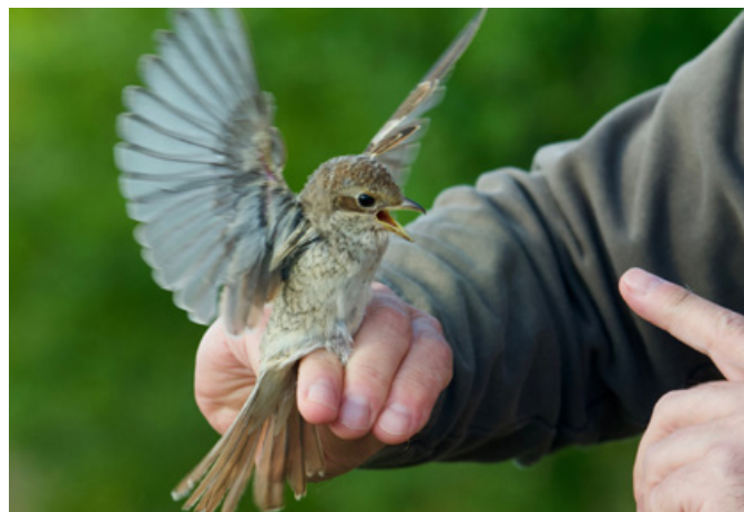
Tur att det finns ringmärkare som kan lära fåglarna hyfs.

... mot en stundande vårsång. Med de dystra siffrorna i stycket ovan i minnet kan man ändå stärkas av att våarna inte visat samma nedgång som höstarna. Våren 2026 har alla förutsättningar för att bli en toppensång! Och du har väl inte missat att vi firar 50 år i år? Detta firar vi under Krisitihimmelfärdshelgen med föreläsningar, panelsamtal, en jubileumsskrift och middag med fest. Och ringmärkning förstås! Vi hoppas på god uppslutning och att många delar med sig av goda minnen. Sjövarnsgården är bokad för helgen och i skrivande stund finns det ännu några lediga bäddar.