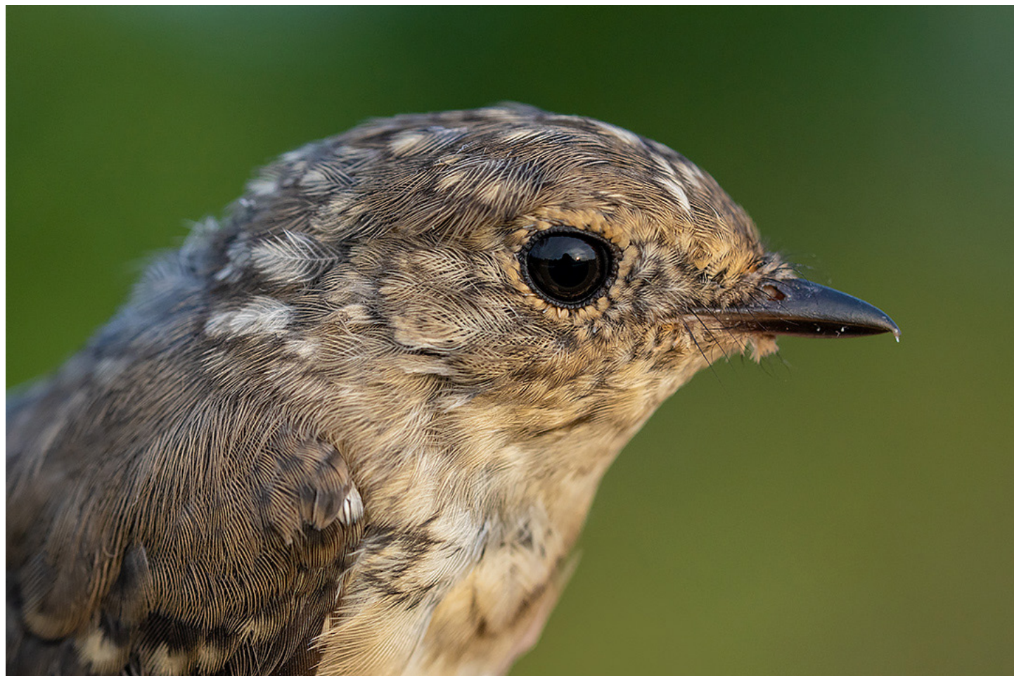
Halbandsflugsnappare CR04545 kontrollerad 22 augusti, 70 dagar gammal.