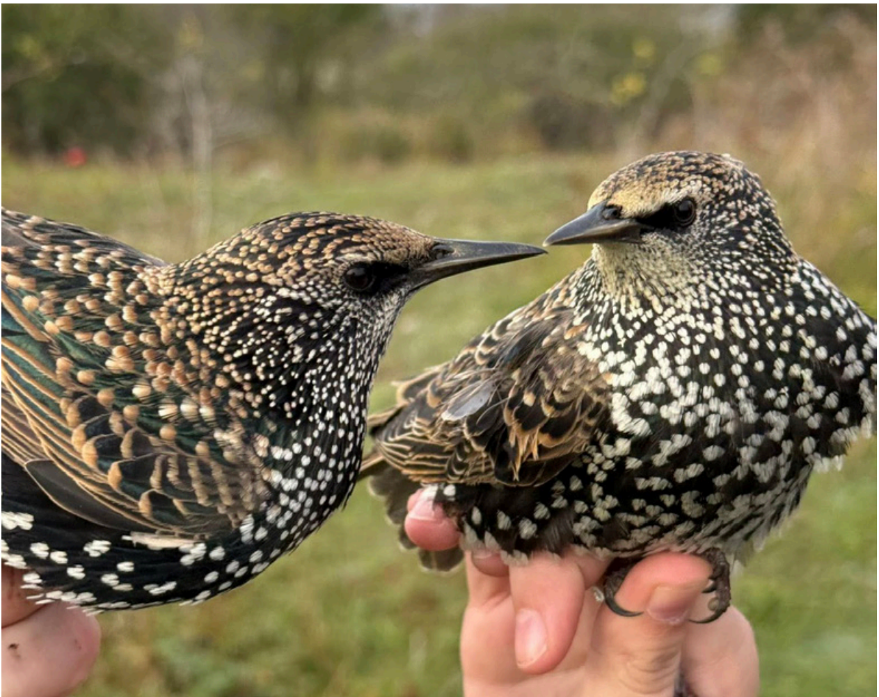
Unga starar (från märkområdet!)