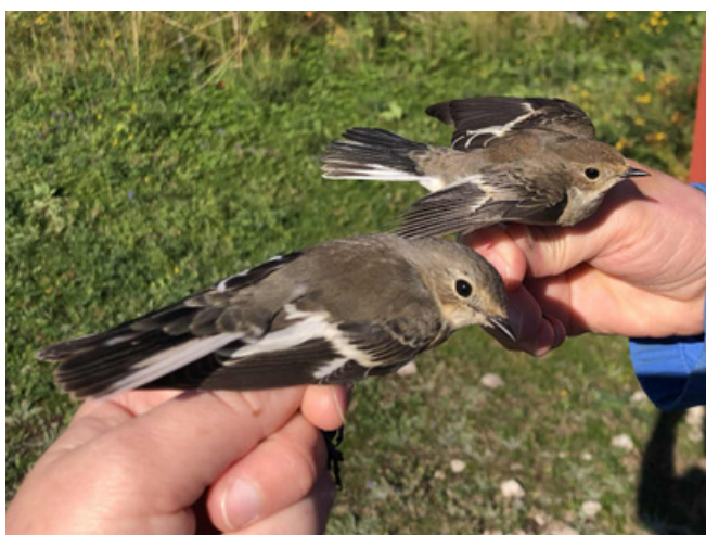
Halsbandsflug t.v. (50), svartvit flug t.h. (114)