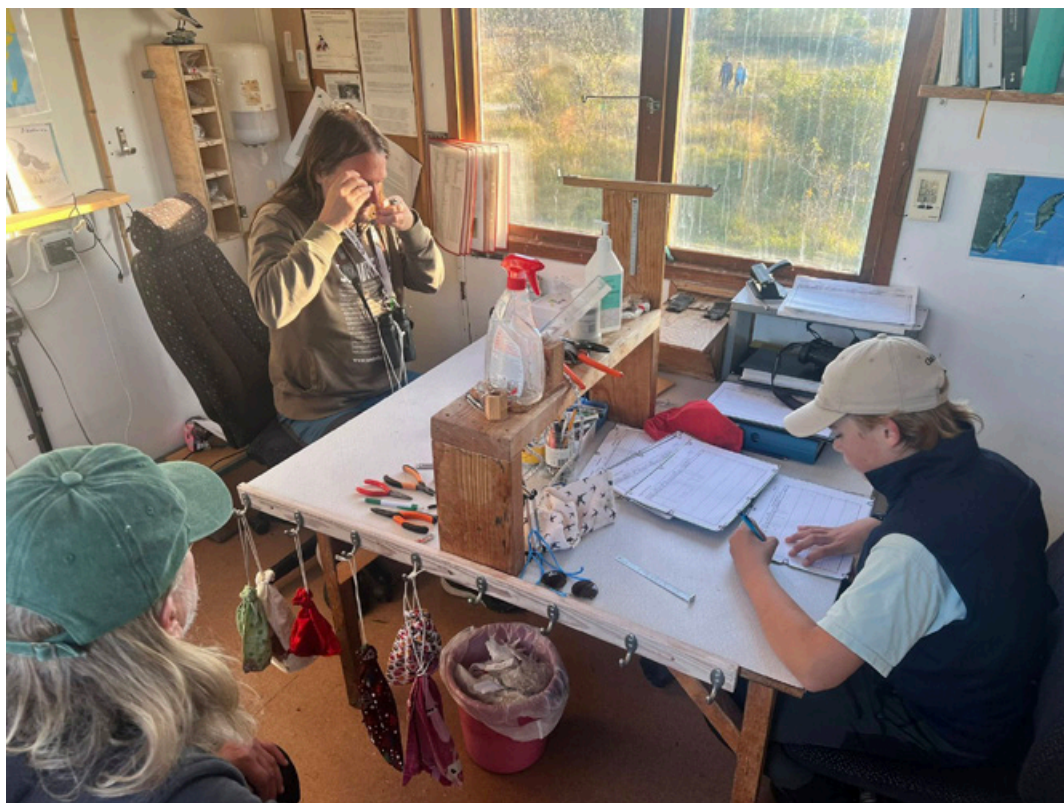
Klassiskt uppsättning: en märkare, en som skriver protokoll och en eller fler gäster.

Totalt ringmärktes 3258 fåglar under hösten med kungsfågel som vanligast (803) medan den standardiserade perioden gav 1695 märkta med lövsångare i topp (350). Totalen för samtlig märkning 2025 blev 6676 och då är lövsångare talrikast (1511).